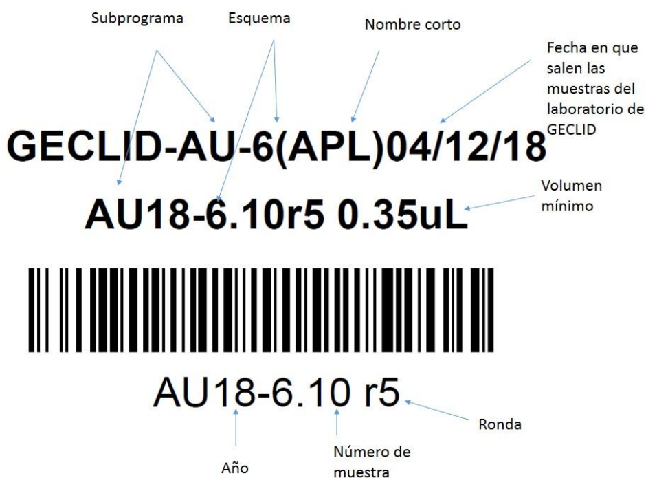
Figura 1. Identificación de muestras